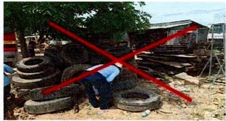
យើងគ្រប់គ្រងចាក់ចោលកម្មសន្ទា