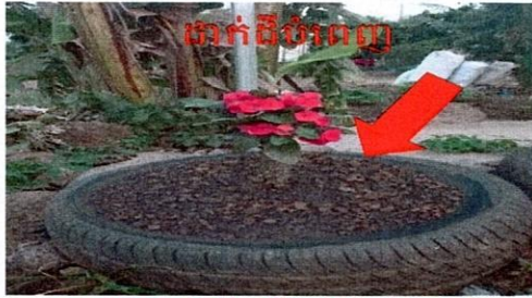
ដាក់ដីបំពេញ