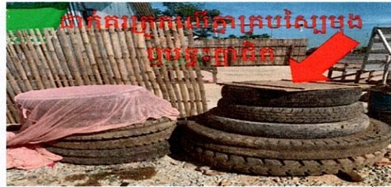
ដាក់គ្រឿងបរិស្ថានក្របស្បែកម្តង ឬប្រេងពូជិត