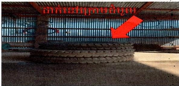
ដាក់នៅក្រោមដំបូល