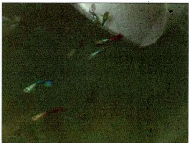
ដាក់ត្រីប្រាំពីរពលីអោយស៊ីដង្កូវទឹក