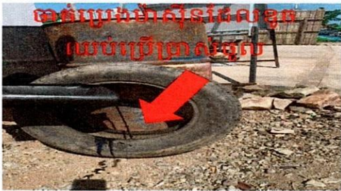
ដាក់ប្រេងម៉ាស៊ីនដែលខូច ឈប់ប្រើប្រាស់ខូច