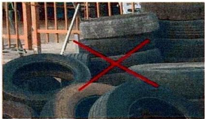
ទឹកភ្លៀងជ្រកក្នុងសំបកកង់ច្បាត ម៉ូតូ ជាលម្អកម្មសន្ទា